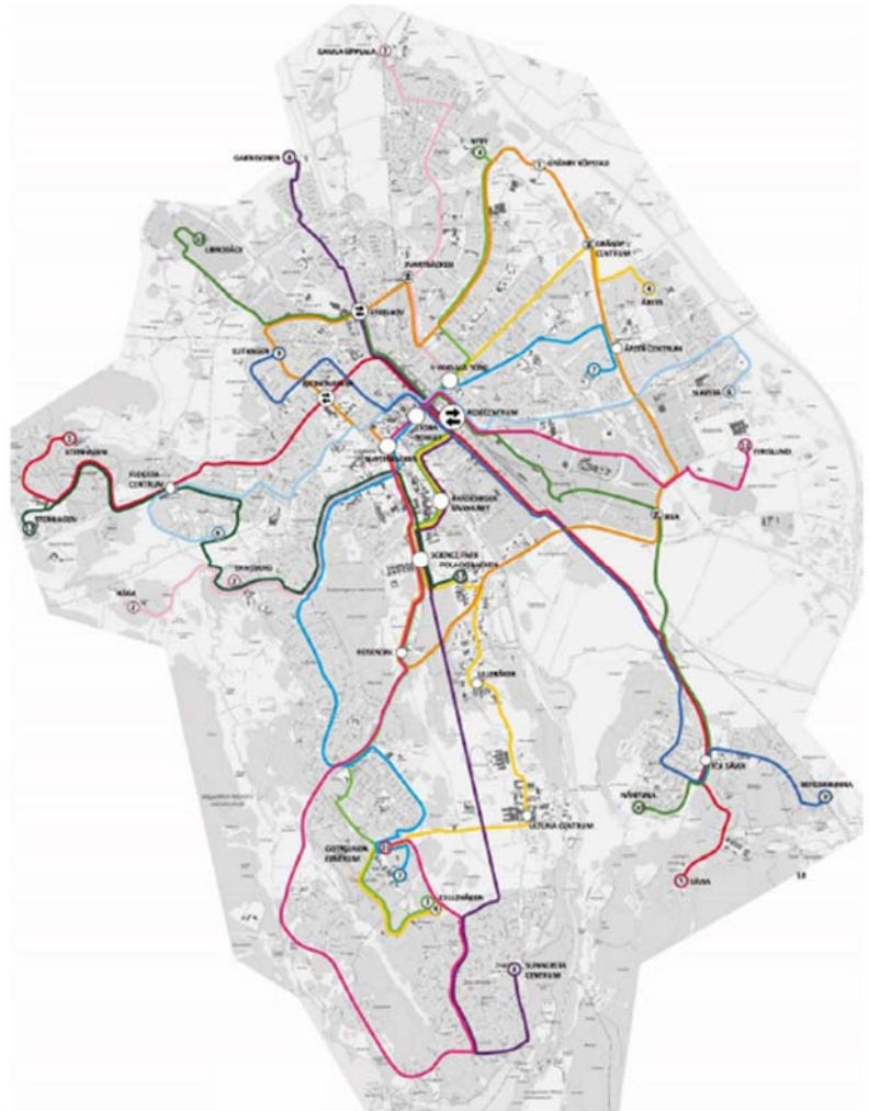
Figur 1. Karta över nya linjenätet.

På dialogmötena skulle besökarna få svar på sina frågor och få en mer utförlig förklaring om varför vissa hållplatser slutar trafikeras och hur de kommer att resa till och från olika målpunkter i framtiden. I foldern som delades ut fanns kortfattad information om det nya linjenätet och den fortsatta arbetsprocessen.